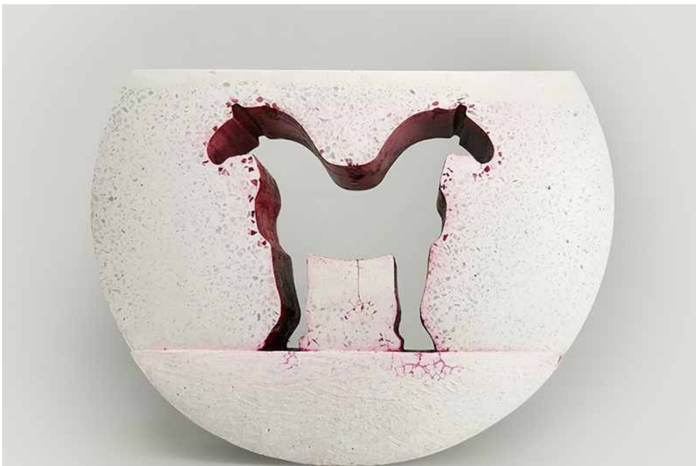
VÖRÖS HIÁNYJEL | KÖZÖS LÓ 2024, fehér beton vörös tintával fesve, 32x23x8 cm