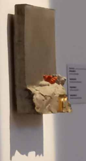
Domborművek a DISZTÓPIA TÁJKÉPEK sorozatból, 2024