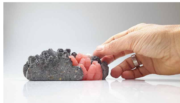
A DISZTÓPIA sorozat korábbi darabjai, balra ZÖLD DISZTÓPIA, 2022, samottos agyag, moha; jobbra fenről lefelé: FEHÉR DISZTÓPIA, 2021 beton porcelán műgyanta; a NÉZZ NAGYON KÖZELRŐL kiállítás részlete a Zöld disztópiával, 2022; DISZTÓPIA plakett, 2019