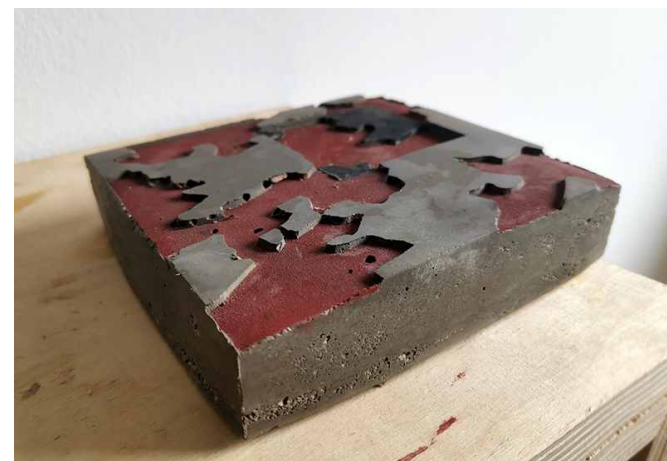
Vázlatok, anyagkísérletek a HIÁNYJEL támára, 2023, anyagában színezett beton