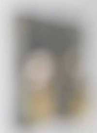
DISZTÓPIA TÁJKÉPEK VIII., 2022, beton, porcelán, aranyfüst, múgyanta, 30x21x4,5 cm