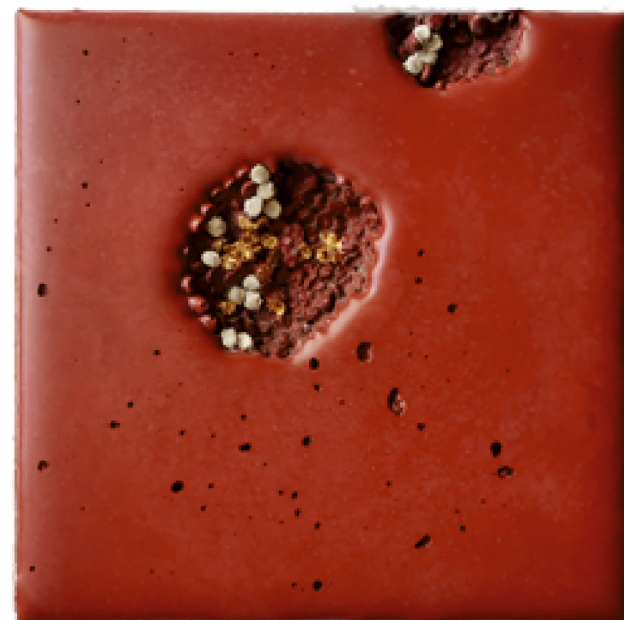
HIÁNYJEL | ÜRES FÉSZEK, 2024 anyagában színezett beton, aranyfüst, múgyanta, 2 db 15x20x2,5 és 15x15x2,5 cm