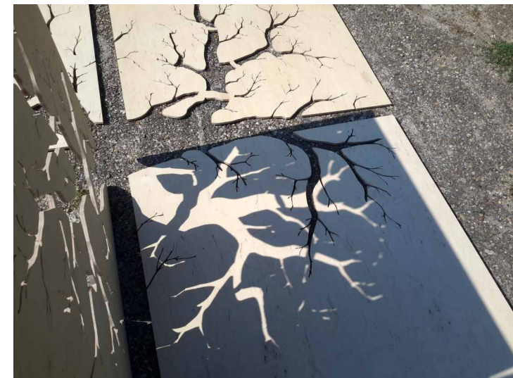
TRANSPARENS TEREK- HIÁNYJEL installáció a gödöllői GIM Ház kiállításán 2018, rétegelt lmez, irányított fények, változó méret