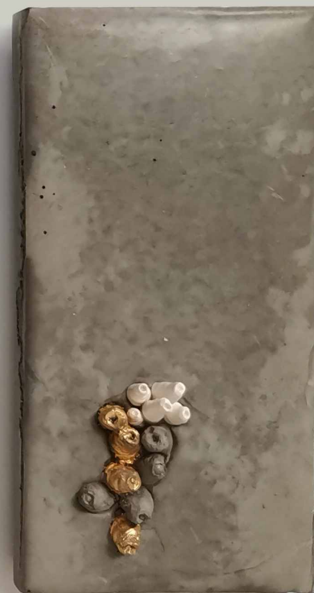
DISZTÓPIA TÁJKÉPEK X-XI. 2024, beton, porcelán, aranyfüst, műgyanta, 24,5x12x3,5 és 25x30x4 cm