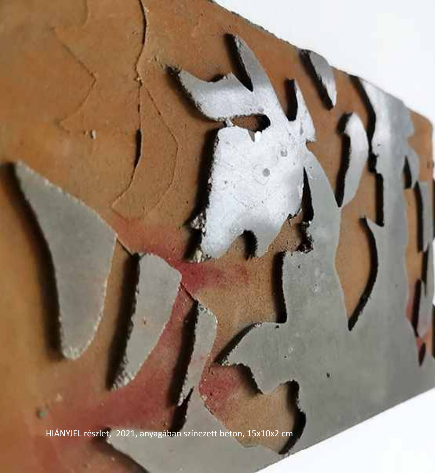
HIÁNYJEL részlet, 2021, anyagában színezett beton, 15x10x2 cm