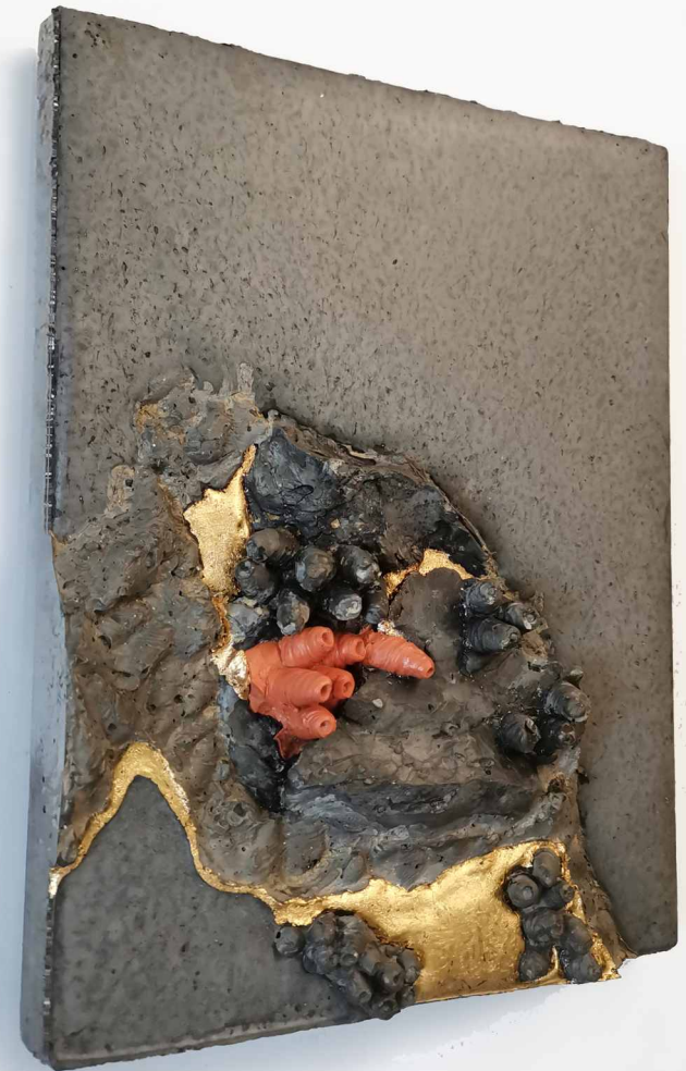
DISZTÓPIA TÁJKÉPEK XV. 2024, beton, aranyfüst, műgyanta, 25,5x33x5 cm