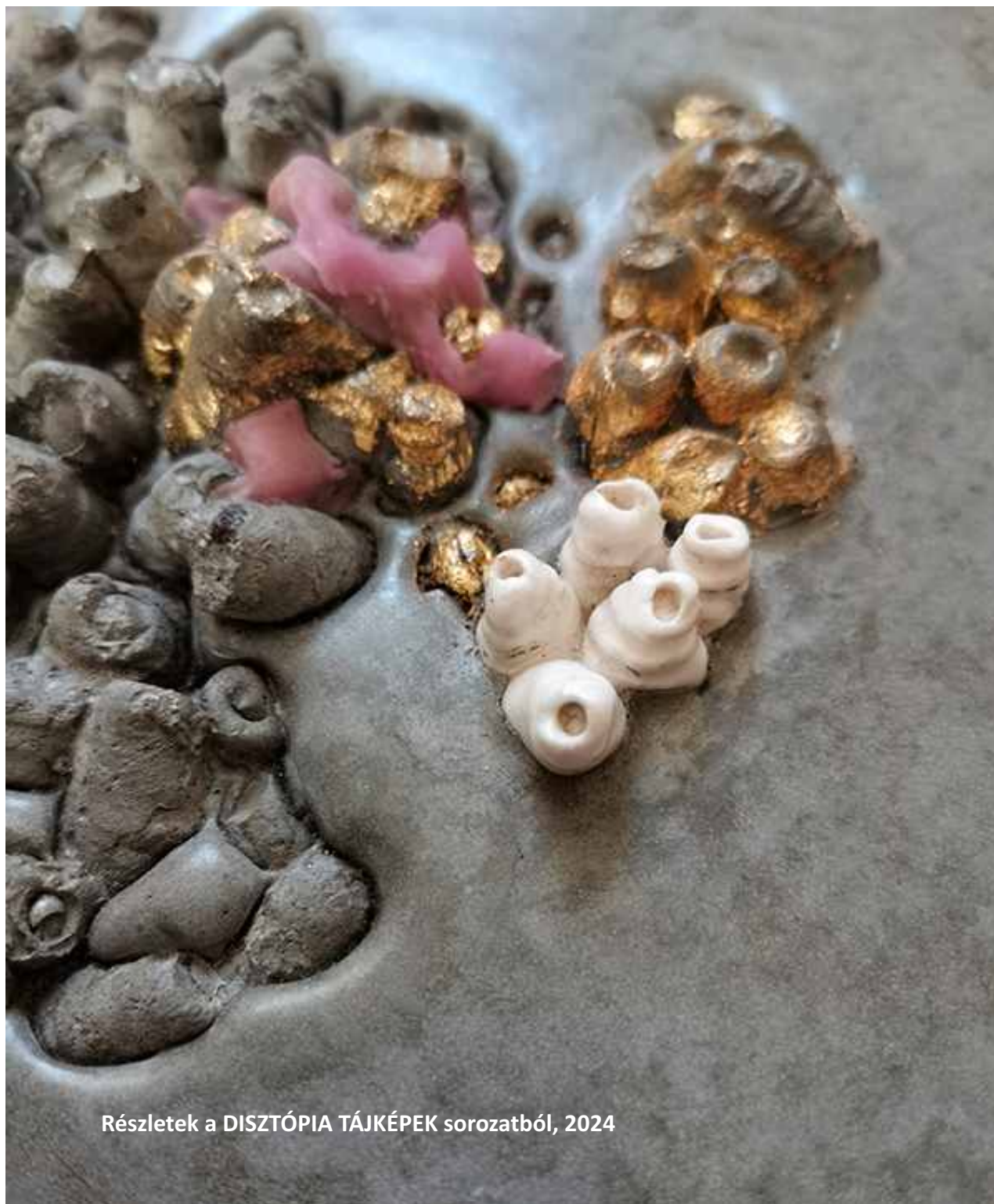
Részletek a DISZTÓPIA TÁJKÉPEK sorozatból, 2024