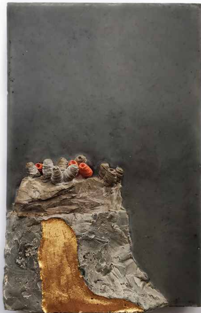
DISZTÓPIA TÁJKÉPEK I-V., 2022, beton, porcelán, aranyfüst, műgyanta, 18,5x21x4,5 / 21x33,5x6 cm