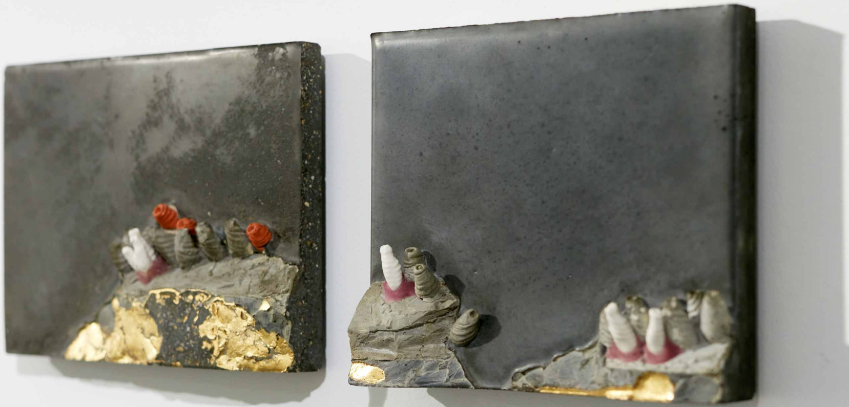
DISZTÓPIA TÁJKÉPEK III-IV., 2022, beton, porcelán, aranyfűst, műgyanta, 24x18x4 / 21,5x18x4,5 cm