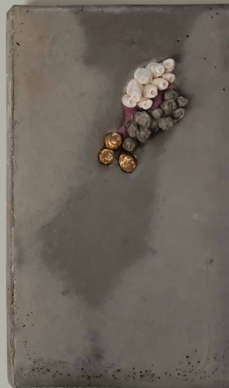
DISZTÓPIA TÁJKÉPEK XII-XIV., 2024, beton, porcelán, aranyfűst, műgyanta, 3 db 28x16x4 cm